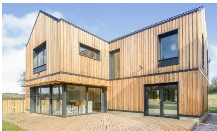
Dieses Passivhaus im britischen Bradford öffnet seine Türen ebenfalls zu den Tagen der offenen Tür, ID 6447.

Häufigere Extremwetterereignisse mit weitreichenden Folgen selbst in Mitteleuropa können nicht ignoriert werden: Auch der Gebäudebereich muss seinen Beitrag zu effektivem Klimaschutz leisten und deutlich weniger Emissionen verursachen. Der Schlüssel dafür sind energieeffiziente Gebäude, die nur sehr wenig Energie fürs Heizen und Kühlen verbrauchen. Die Tage offenen Tür im Passivhaus vom 5. bis 7. November 2021 belegen, dass diese zukunftsfähigen Gebäude schon jetzt weltweit