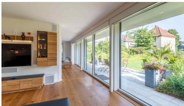
Dieses Passivhaus im bayerischen Rosenheim kann bei den Tagen der offenen Tür besucht werden. Weitere Informationen in der Projektdatenbank unter der ID 6055.

Darmstadt. Der Schlüssel für besseres Bauen ist hohe Energieeffizienz: Nur mit Gebäuden, die deutlich weniger Energie fürs Heizen und Kühlen verbrauchen, gelingt der Klimaschutz im Gebäudebereich. Vom 5. bis 7. November 2021 laden Bewohner von Passivhäusern rund um den Globus zu sich nach Hause ein. Vom kanadischen British Columbia übers britische Bradford bis Bayern sind zahlreiche Besuchsmöglichkeiten in der Projektdatenbank des Passivhaus Instituts eingetragen. Dabei können Besucher selbst erleben, wie Gebäude im Passivhaus-Standard das Klima schützen und gleichzeitig Komfort und Wohngesundheit bieten. Es gibt Angebote für Besuche vor Ort und virtuell. Auch das weltweit erste Passivhaus in Darmstadt lädt ein.