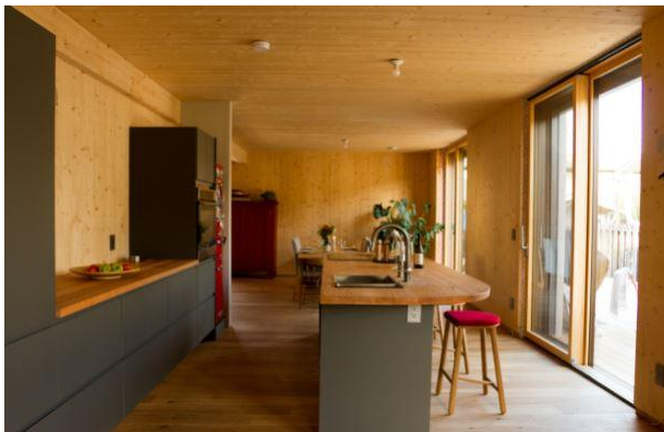
Im kanadischen British Columbia öffnen die Bewohner dieses Passivhauses ihre Türen, ID 6402.

Äußerst energieeffiziente Häuser im Passivhaus-Standard sind wegen ihres geringen Energieverbrauchs geschätzt und sie bieten gleichzeitig Vorteile bei Komfort und Wohngesundheit: Im Winter hält sich die Wärme lange im Haus, auch aufgrund der guten Wärmedämmung. Im Sommer bleibt genau deshalb die Hitze draußen. Die Lüftungsanlage mit Wärmerückgewinnung sorgt für konstant frische Luft. Die vom Passivhaus Institut empfohlenen Frischluftfilter in der Lüftungsanlage können neben Stäuben und Keimen auch die Gefahr durch Aerosole verringern.