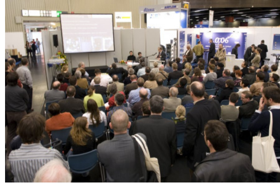
Passivhaus-Ausstellung 2010, und Hersteller-Forum (Dresden), Foto:Passivhaus Institut