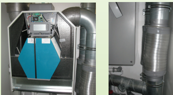
Komfortlüftung mit Wärmeübertrager