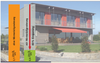
Lüftungsverluste mit und ohne Wärmerückgewinnung

Der Wärmebereitstellungsgrad einer Lüftungsanlage gibt an, wieviel Energie (Wärme) der Zuluft übertragen wird. Der Wärmebereitstellungsgrad sollte mindestens 75% betragen.